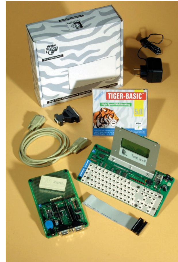
BASIC-Tiger® Starter Kit

support@wilke.de Tel: 02405-408 550 Fax: 02405-408 554 44